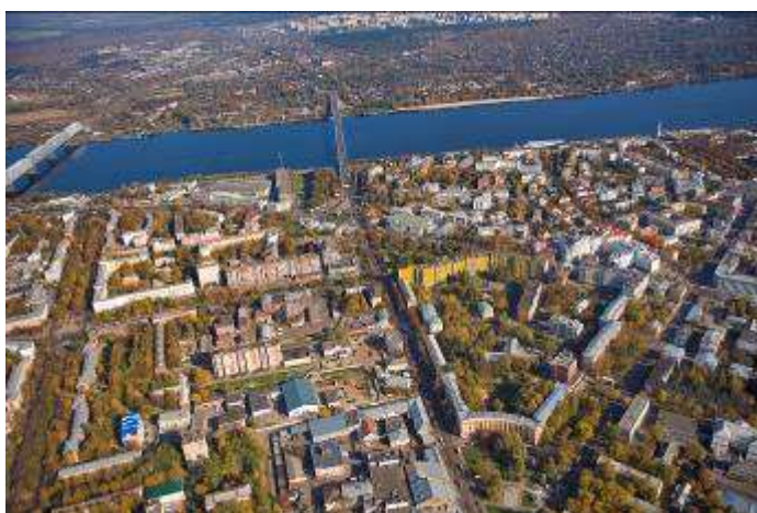
Вид на город с птичьего полета

Целых десять столетий Над тобой пролетело, Но средь бед, лихолетий, Были Слово и Дело. Ты бывал и столицей, Ты бывал и в опале, Огневые зарницы Над тобою пылали,