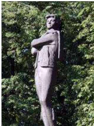
Памятник Федору Григорьевичу Волкову, основателю русского театра.

Воспарили над жизнью Богомазов, артистов Вдохновенные кисти, Рифм хрустальные брызги.