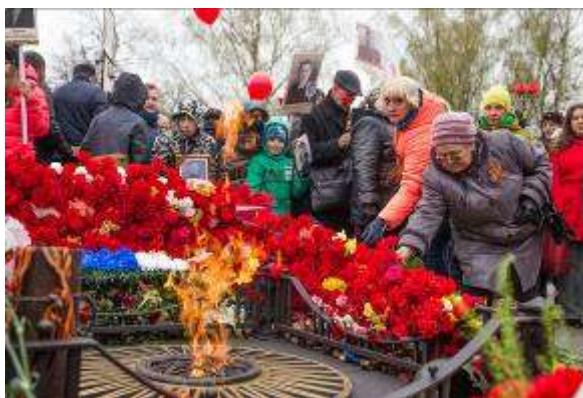
У Вечного Огня в День Победы 9 мая

Ты сберег в своих храмах Древнерусское Слово, Верил в Бога упрямо, В Сына, в Духа Святого.