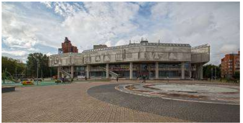
Театр юного зрителя