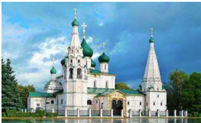
Церковь Ильи Пророка

Дремлет Угол Медвежий, Зной у церкви Пророка,