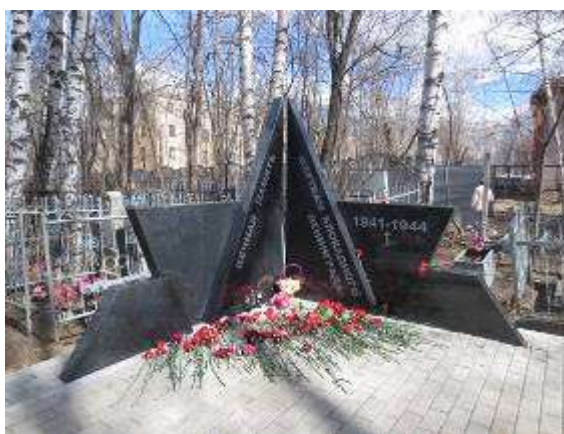
Памятник жертвам Ленинградской блокады