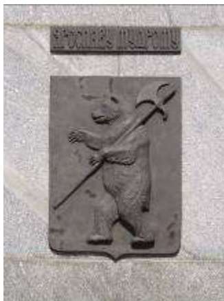
Герб города Ярославля

Под медведем с секирой Колоколен шатрами, Нашей юности символ, Ты горишь куполами.