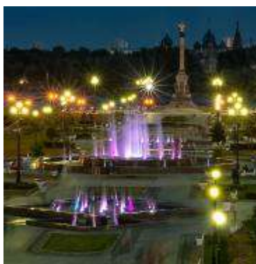
Стрелка, фонтаны, вечер