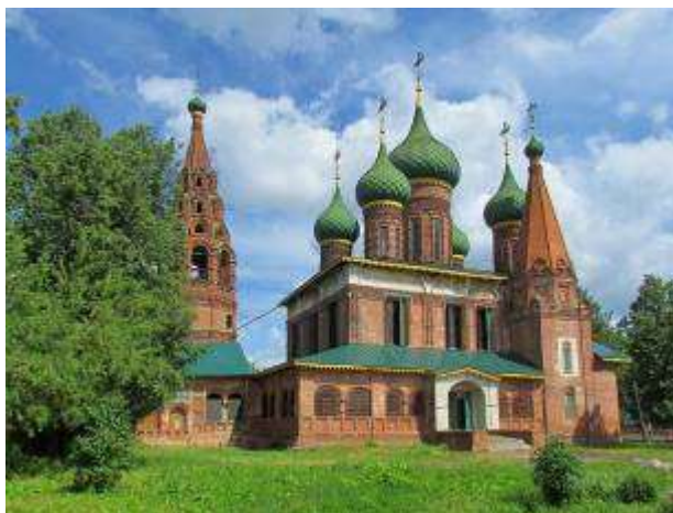
Храм Николы Мокрого

Ты сберег в своих храмах Древнерусское Слово, Верил в Бога упрямо, В Сына, в Духа Святого.