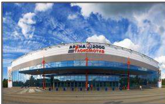
Арена 2000 Локомотив

Береженьем, трудами, Ты стройнел, красовался, Каждой гранью сверкая К небесам поднимался.