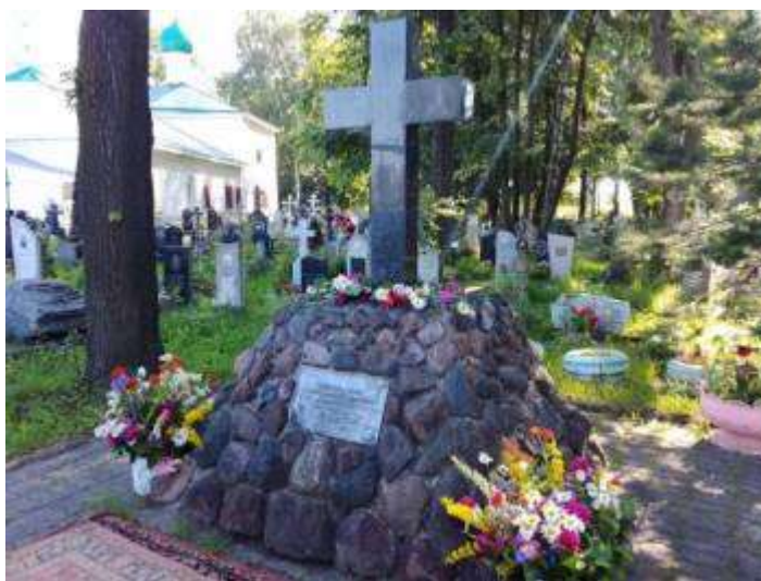
Памятник защитникам города от нашествия татаро-монгольского нашествия

Твои войны бились На горе знаменитой, Не сдавались на милость Ордам в сечах великих.