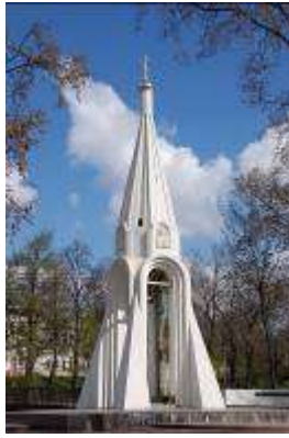
Часовня Казанской Богоматери Памятник торжественно открыт в августе 1997 года честь 385-летия выхода ополчения на Москву

Береженьем, трудами, Ты стройнел, красовался, Каждой гранью сверкая К небесам поднимался.