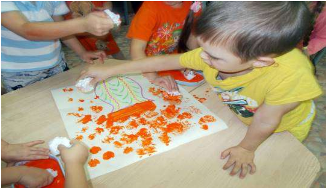
Необычный способ рисования букета ватой

Очень красивые тюльпаны получаются с помощью вилки. По ходу занятия объясняем, что краски, карандаши, мелки – не единственные предметы для рисования. Если проявить фантазию, можно нарисовать много цветочных композиций. Растения получаются довольно похожими, красивыми.