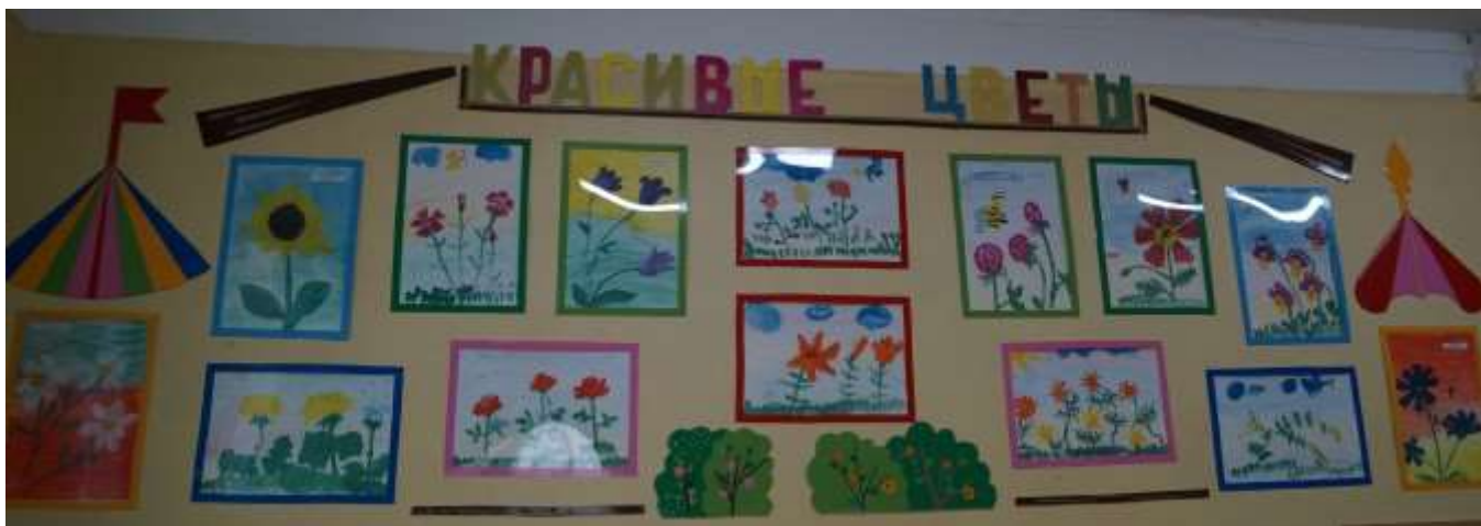
Стенд с цветами

Занятие по изобразительному искусству на тему «Красивые цветы» учит различать растения по видам, помогает определить размер. Красивые букеты в интерьере воспитывают эстетические чувства. Приучает детей к аккуратности. Изображать цветы можно карандашами, фломастерами, красками. Помимо этого, на столе у ребят должны быть кисти, емкости с водой, салфетки для удаления грязи, листы бумаги.