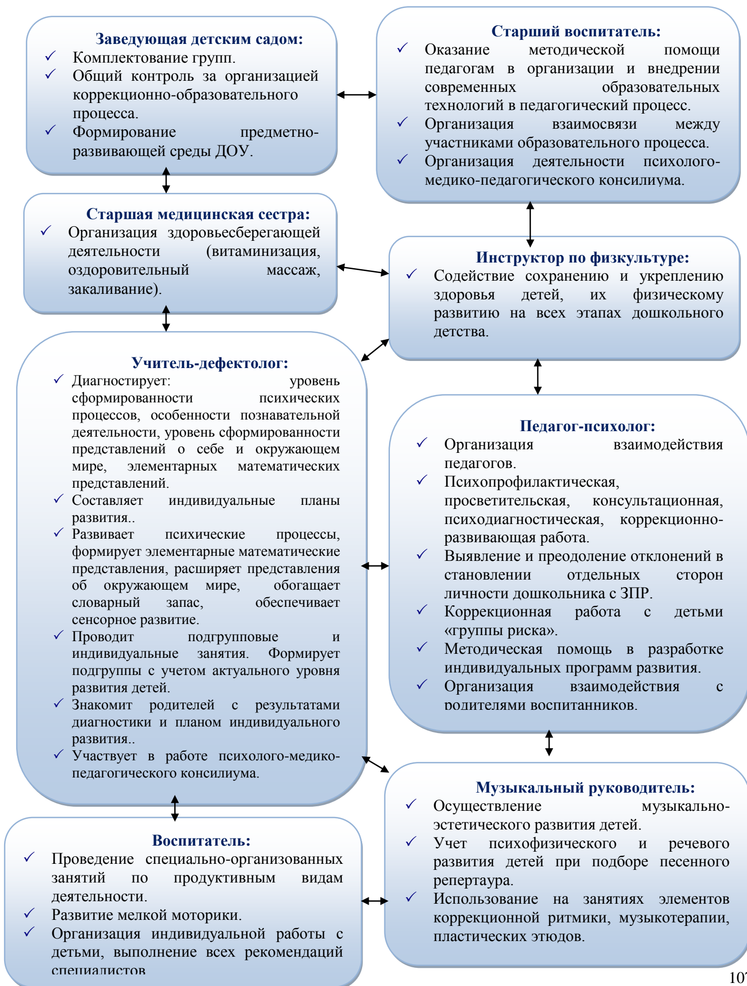
Схема 1. Модель взаимодействия педагогов ДОУ в работе с детьми с ОВЗ.