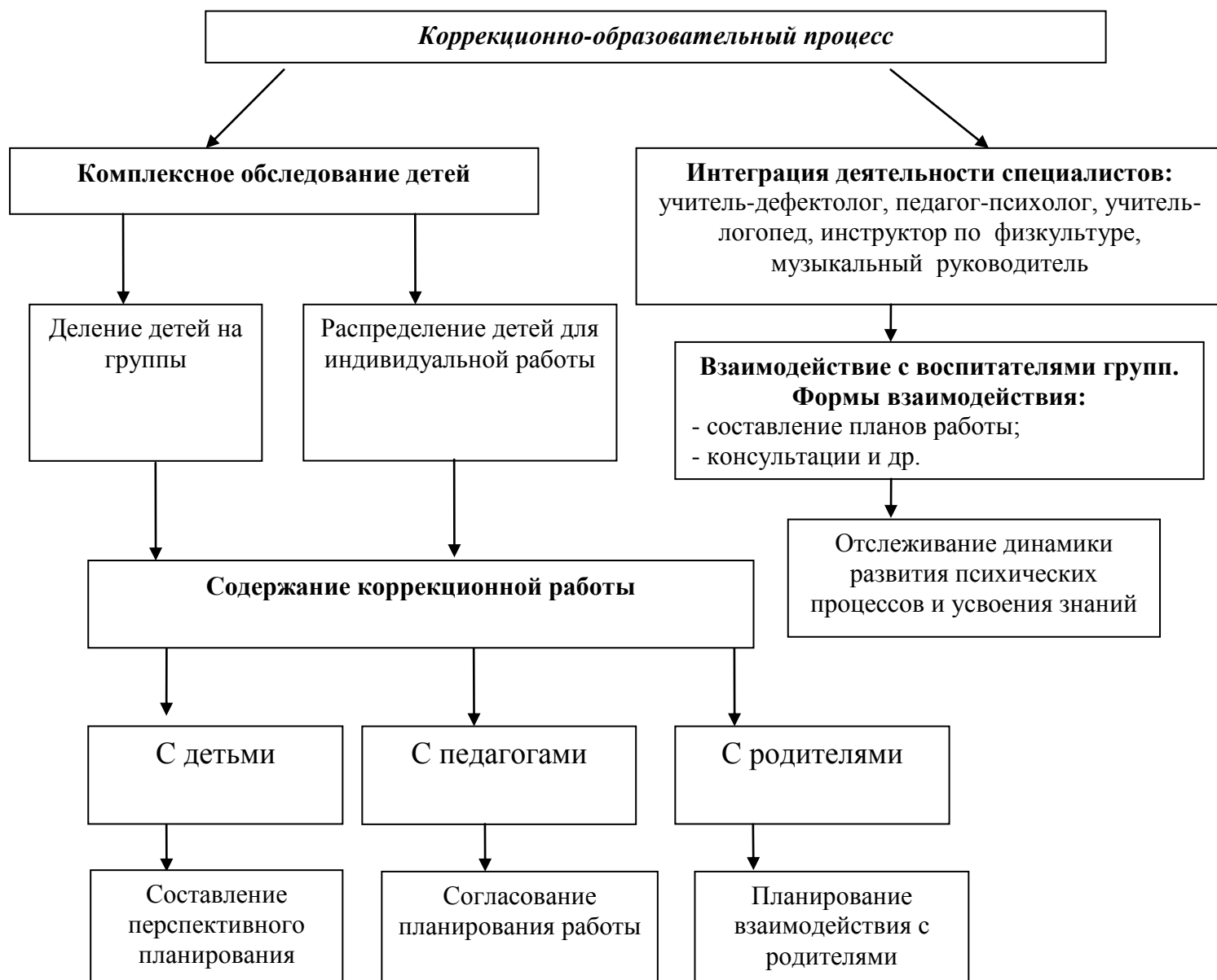
Схема 2. Организация коррекционно-развивающей работы в группах компенсирующей направленности для детей с задержкой психического развития.

Организация коррекционно-развивающего процесса в группах компенсирующей направленности МДОУ «Детский сад № 215» имеет ряд характерных особенностей: