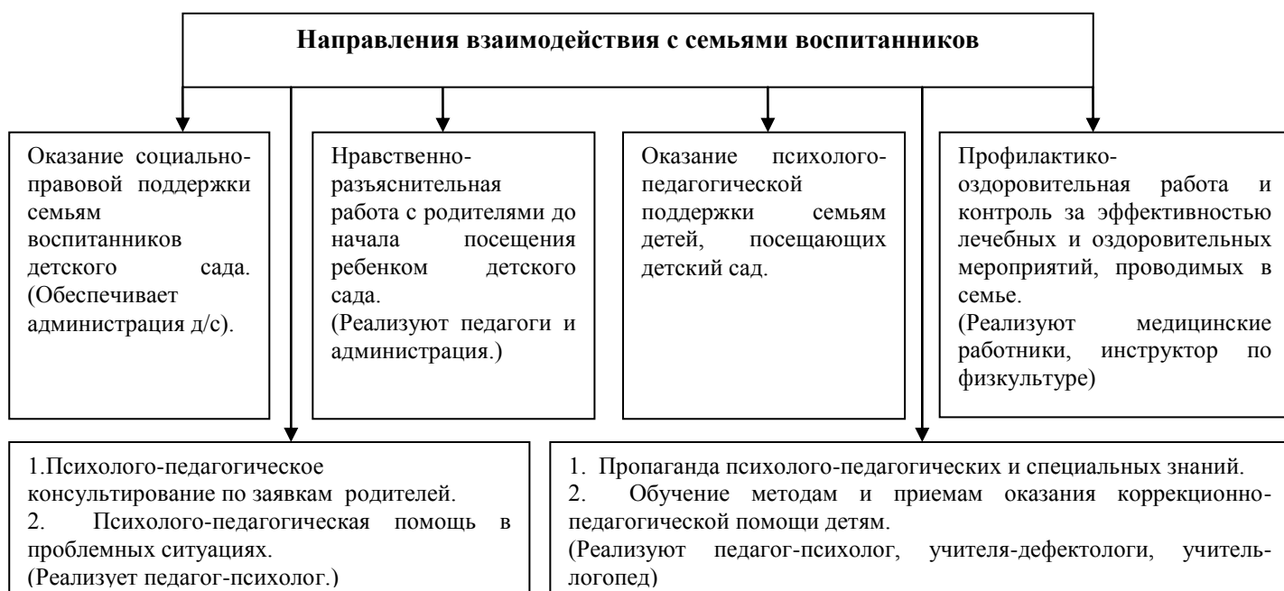
Схема 4. Основные направления взаимодействия ДООУ с семьей.