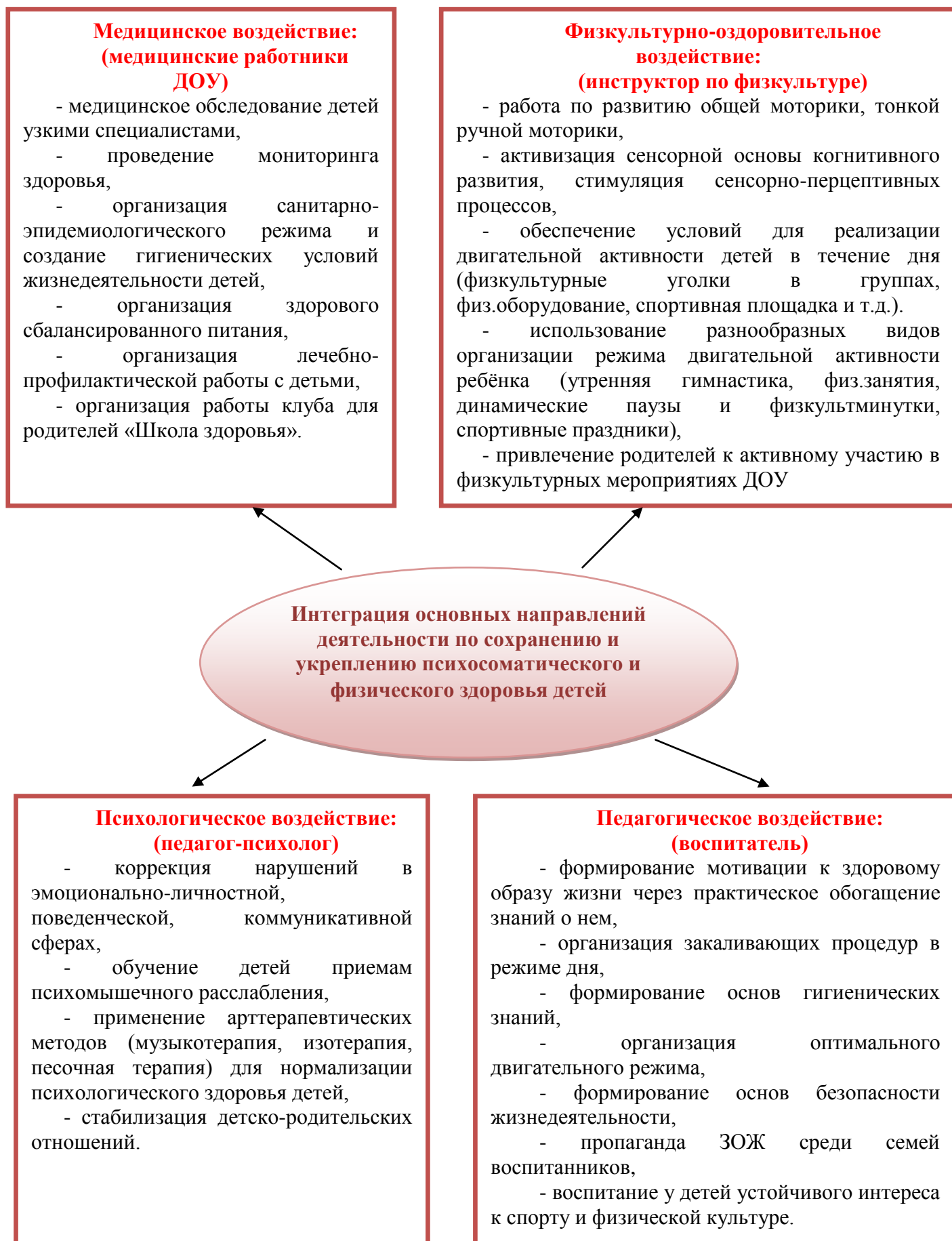
Схема 6. Система физкультурно-оздоровительной работы в МДОУ «Детский сад № 215»