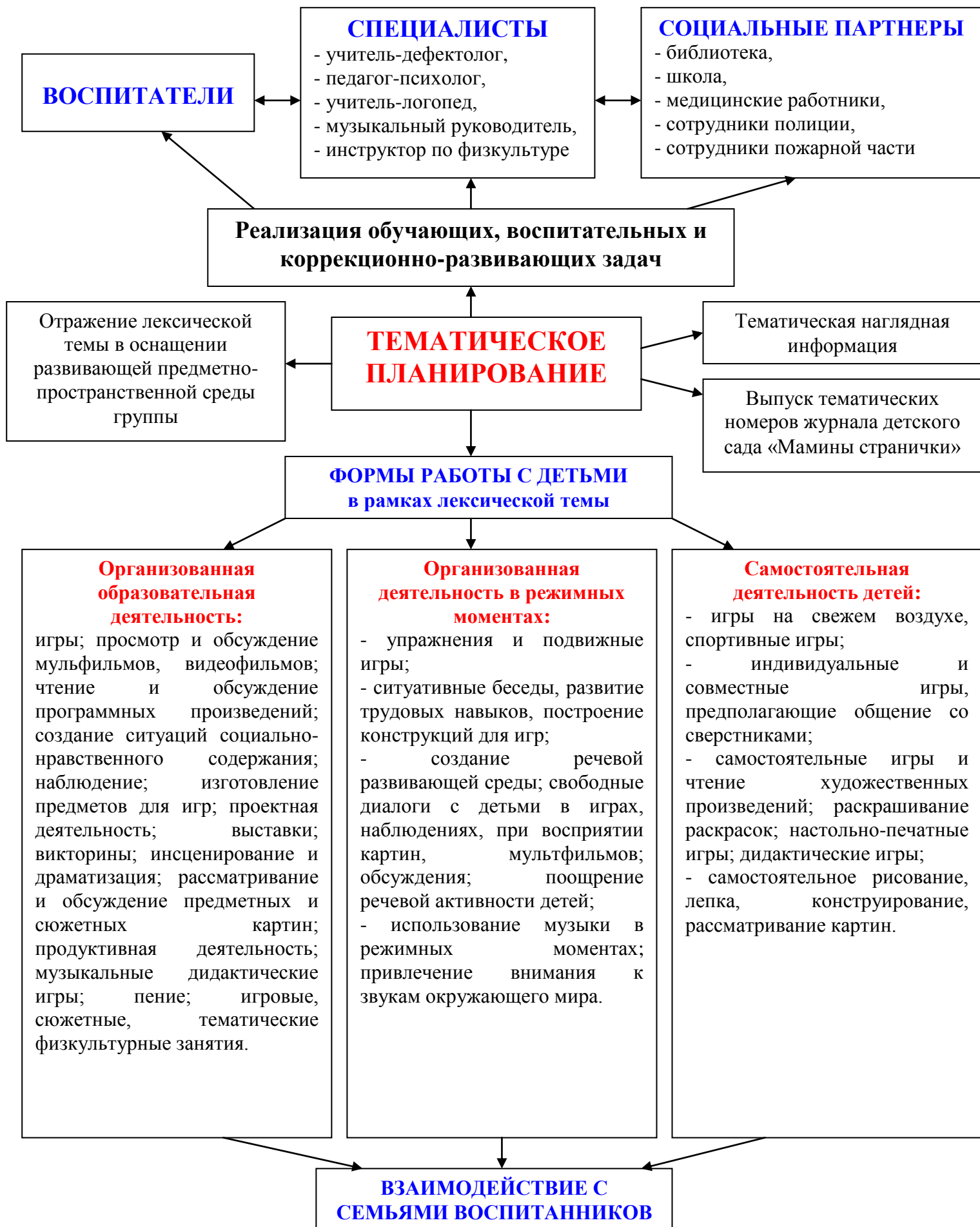
Схема 7. Тематический подход к проектированию образовательной деятельности ДОУ.